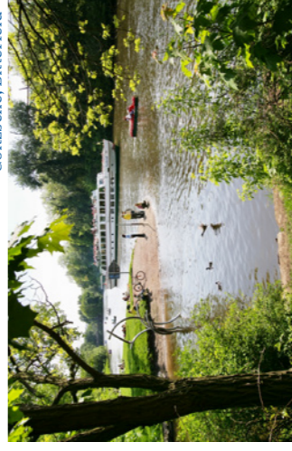
Saale, Halle River Saale, Halle